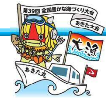
大会キャラクター 「んだっちゃん」