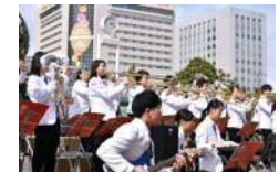
歓迎演奏イメージ