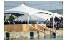
御放流台イメージ