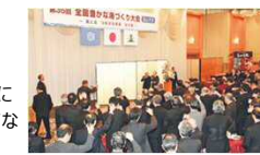
富山大会の歓迎レセプション会場

県内外からの招待者に秋田県が誇る農林水産物を豊富に 使用したメニューを堪能してもらい、豊かな秋田の食でおもてな します。